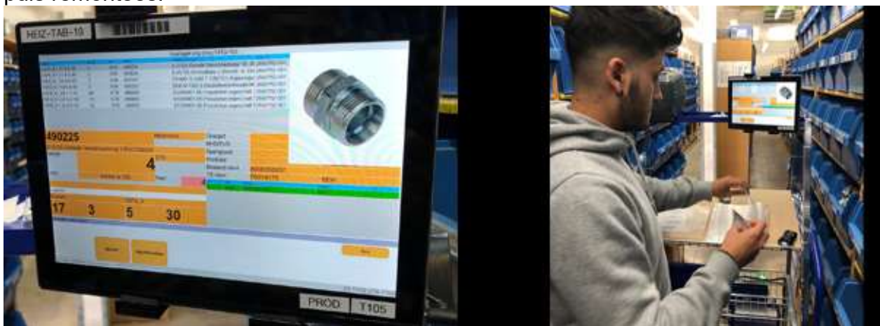
So sehen die Logistikmitarbeiter die neuen Kommissionier Aufträge auf den Tablets und mit den speziell für die Kommissionierung hergestellten Wagen wird der eigentliche Prozess um Meilen vereinfacht.