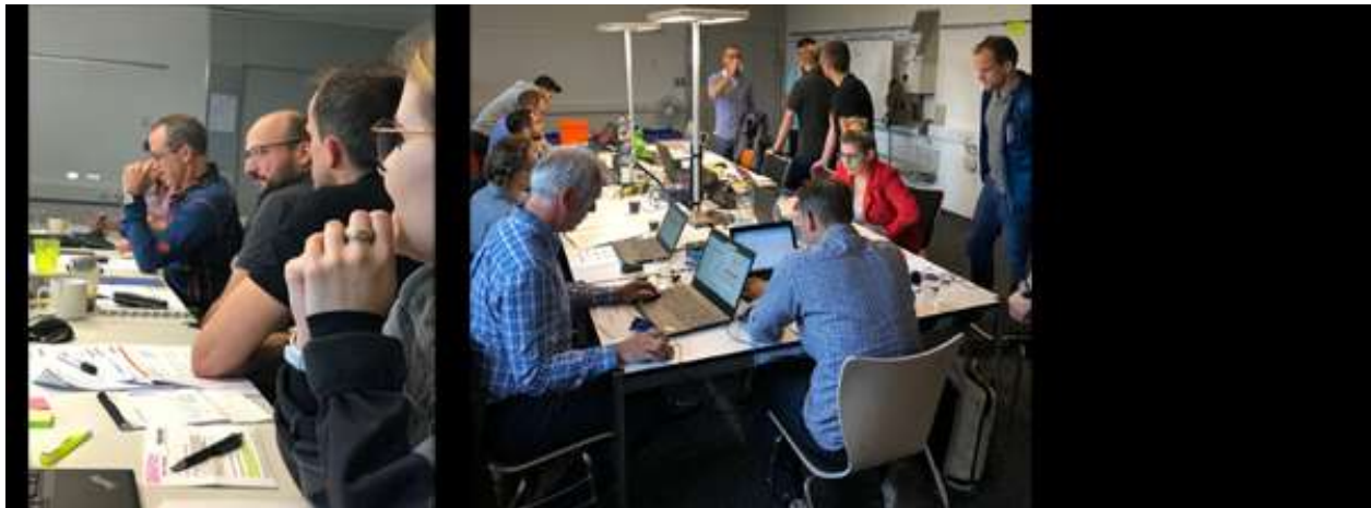
Konzentriertes Arbeiten während dem Pfingstwochenende 2018. Travail concentré durant le week-end de Pentecôte 2018.