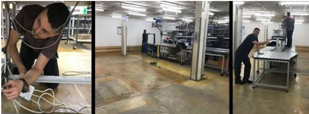
Unterdessen werden die Kommissionier Strassen abgebaut und neu ausgerichtet wieder aufgebaut. En attendant, les lignes de préparation des commandes sont démontées, réorganisées puis remontées.